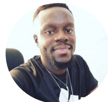
Obin Gyako BabyLab Côte d'Ivoire